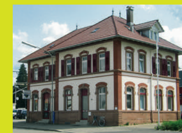
Bahnhof Lörrach-Stetten Basler Str. 24 79540 Lörrach

Drei Standorte mit modern ausgestatteten Unterrichtsräumen bieten alle Möglichkeiten für zeitgemäßen Musikunterricht.