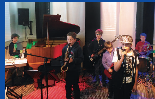
Band-Play – für alle, die gerne in einer Band spielen wollen

Sa 21. April, 10–14 Uhr (mit Pause), ab 12 Jahren Gebühr: 48.– TYTH-Schüler: 38.–