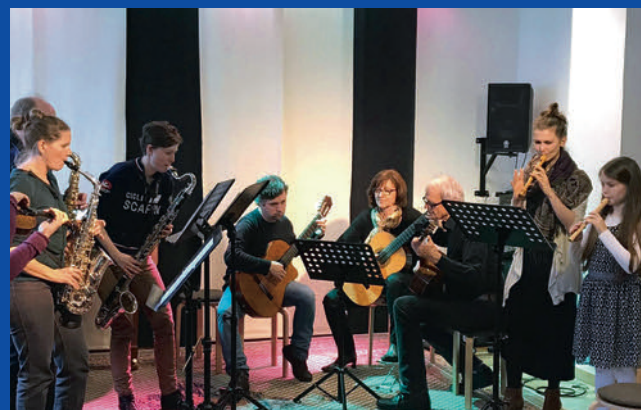
Ensemble-Tag – gemeinsam musizieren im Schnupper-Ensemble

Im Bahnhof finden regelmäßig gemeinsame Schülervorspiele unserer Dozenten statt. Wir freuen uns auf Ihren Besuch.