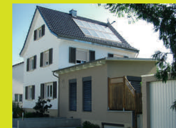
Lörrach-Stetten Schönaustr. 27 79540 Lörrach