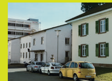
Brombach Schopfheimer Str. 25 79541 Lörrach