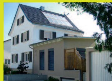
Lörrach-Stetten Schönaustr. 27 79540 Lörrach