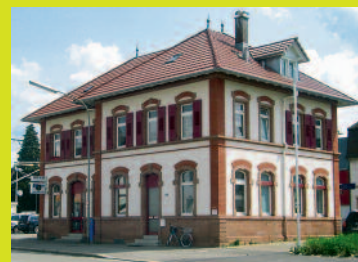
Bahnhof Lörrach-Stetten Basler Str. 24 79540 Lörrach

Drei Standorte mit modern ausgestatteten Unterrichtsräumen bieten alle Möglichkeiten für zeitgemäßen Musikunterricht.