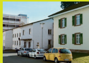
Brombach Schopfheimer Str. 25 79541 Lörrach